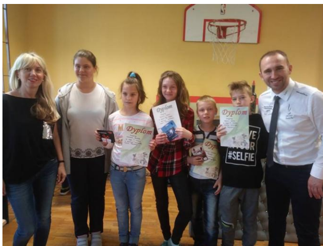
Laureaci wraz z członkami komisji konkursowej

W dniu 17 kwietnia br. w Szkole Podstawowej w Bojszowie odbył się konkurs dla młodych artystów „Mam Talent 2018”. Dzieci wszystkich oddziałów stanęły do rywalizacji o cenne nagrody. Repertuar młodych wykonawców był bardzo zróżnicowany. Uczniowie zaprezentowali swoje umiejętności wokalne, muzyczne, recytatorskie, taneczne, gimnastyczne i iluzjonistyczne. Jury miało nie lada orzech do zgryzienia, aby spośród 15 występów wyłonić te najlepsze, gdyż każde z dzieci przygotowało swój występ do perfekcji. Po długich obradach jury podjęło decyzję.