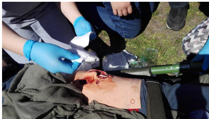
Praktyczne ćwiczenia z udzielania pierwszej pomocy