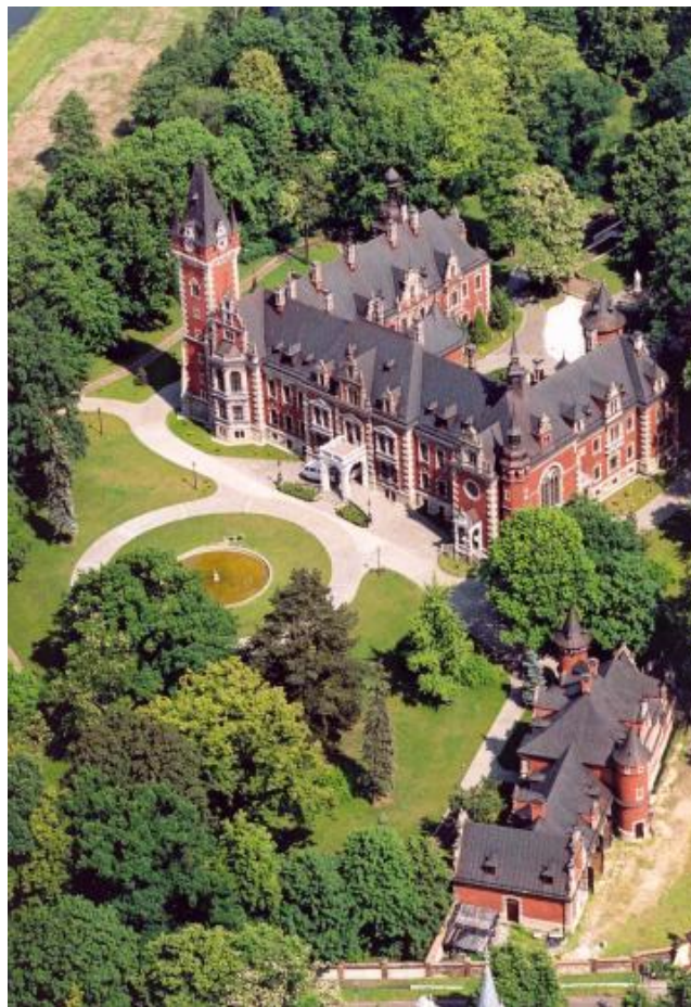
Zespół Pałacowo-Parkowy w Pławniowicach z lotu ptaka