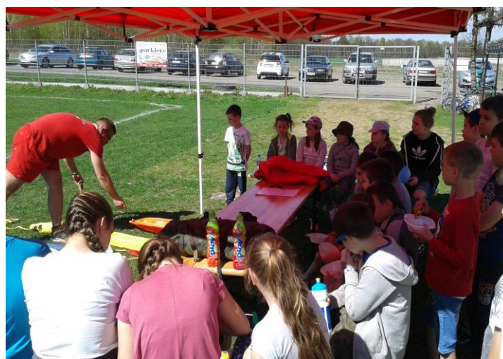
Wykład na temat udzielania pierwszej pomocy